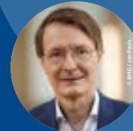
Prof. Dr. med. Karl Lauterbach Bundesgesundheitsminister

Der SpiFa-Fachärztetag 2024 bot spannende Diskussionen und Impulse von prominenten Gästen, darunter: